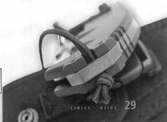
Détail du talon du manche dont l'interframe en acier forme une excroissance.

De fait, la nouveauté Extrema Ratio n'est pas monstrueuse par sa taille puisque sa longueur atteint 26 cm en position ouverte