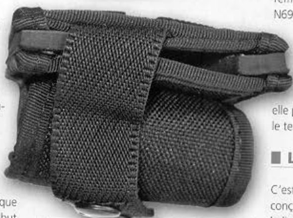
Vue de la partie supérieure de l'étui. Entre les deux renforts apparaît le logement de la lame du RAO.

suffit de remplacer l'anneau métallique par un petit élastique, qui limite aussi l'entortillement du lien.