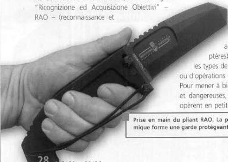
Prise en main du pliant RAO. La poignée massive mais ergonomique forme une garde protégeant les doigts.

un entraînement spécial d'une durée de 2 années au cours duquel ils ont appris à s'infiltrer, à agir et à survivre en milieu hostile. La devise de l'unité en est sans équivoque: "Videre Nec Videri", ce qui en latin signifie "Voir sans être vu". En juin 2006, le 158 e RAO a chargé Extrema Ratio de développer un modèle adapté à ses missions spécifiques. Quelques mois ont été nécessaires pour figer les caractéristiques définitives et tester les premiers prototypes avant de valider ce couteau qui porte désormais le nom de cette unité prestigieuse. La version définitive, qui a été présentée au public lors de l'IWA de Nuremberg en mai dernier, est celle qui fait l'objet de ce banc d'essai. Parallèlement, les membres du RAO sont partis au Liban avec leur nouvelle arme blanche.