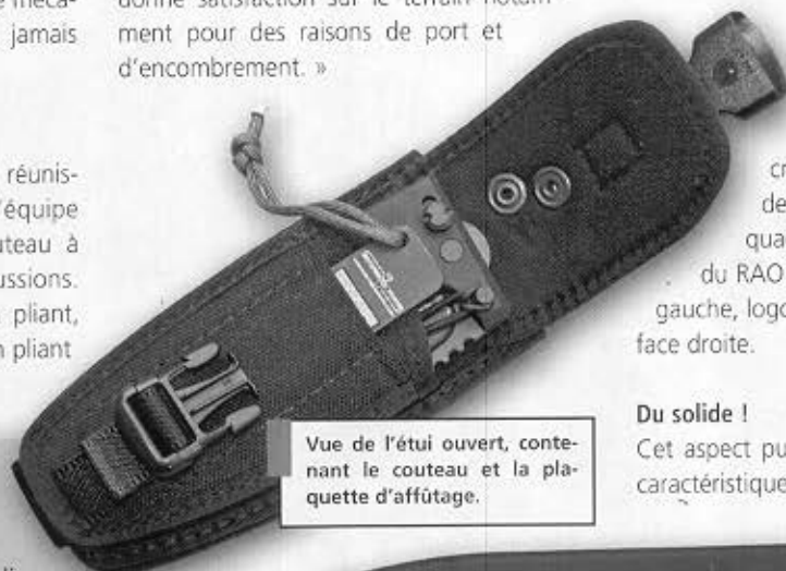
Vue de l'étui ouvert, contenant le couteau et la plaquette d'affûtage.

manche ergonomique ; casse-tête au talon du manche ; livré avec plaquette d'affûtage